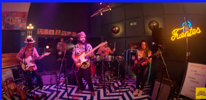
TIRO AL BLANCO