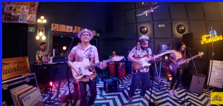
MAR DE EMOCIONES