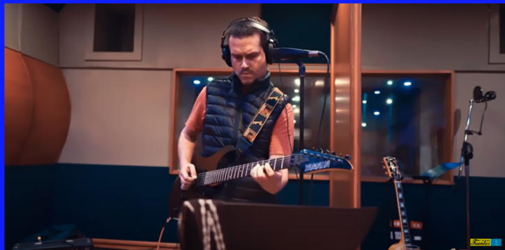
LA DANZA DEL MONO